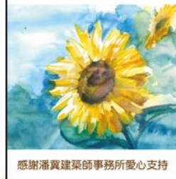
感謝潘翼建築師事務所愛心支持