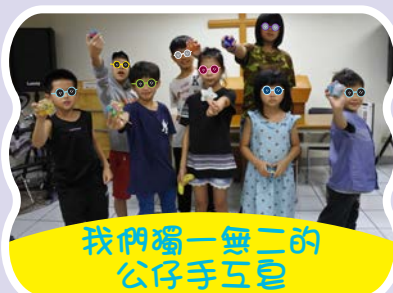
我們獨一無二的 公仔手工皂