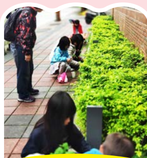
拔拔野草也是 透透氣的好點子