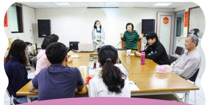
傳媽媽勉勵自立少年勇往直前

己的慣用人際模式，社工運用撒提爾4種人際模式，帶領學員們做肢體雕塑，分別介紹討好型、責備型、超理智型及打岔型的行為表現及內在心理想法，希望學員藉此了解自己的溝通模式，進而反省並調整練習健康的溝通模式，而助益於人際關係、職場生活和家庭生活。