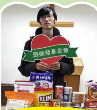
自立少年感動 接受豐富物資

接連幾個月的疫情肆虐下，有好些自立少年打工都受到影響，有的被減班、有的停班，生活馬上受到影響，個個掛著無助擔憂的臉龐，不知如何是好……。有好幾位愛我們的捐助人知道這個消息之後，送來了很豐富的物資，當大孩子們看到滿桌的豐富的物資時，幾乎都驚訝的張了嘴，說不出話來，接著則是笑逐顏開的直說：「真的太多了…」相信這些美好物資，可以幫助自立少年度過這一段蕭條的日子，並在心裡留下溫馨感動的印記。