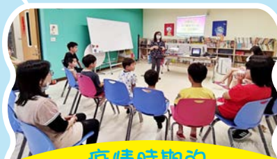
疫情時期的 主恩兒童聚會

到了3月為了避免群聚，我們便把每周的大聚會改成兩個小聚會，一個在松江路、一個在主恩。座位也用長條桌隔開了彼此，全程戴口罩，除了敬拜和信息之外，花更多時間在為台灣及全球疫情同心合意守望，雖說距離拉開了我們，但心卻是緊緊靠在一起。