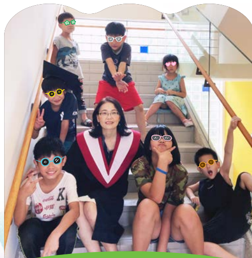
開心和主恩孩子們 一起慶祝畢業

最後，藉此機會跟所有基金會大小孩子們分享：挫折就像擋在眼前的石頭，它會讓人卻步不前，但如果能勇敢地將其當作墊腳石，就能藉著站得更高，看得更遠；這些都是上帝賜予的功課與禮物，相信天父自有安排，勇敢的接受它吧！不要忘了在兒家，你不孤單。