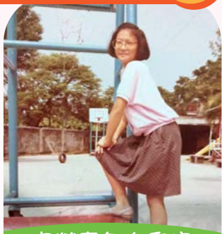
宜瑩童年在兒家 籃球場留影