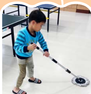
廷廷好認真的 拖地