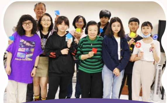
媽媽們參與自立少年活動後合影

歡迎您支持搶救自信心大作戰企劃及暑假小旅行活動，並為11萬元經費關心代禱，謝謝您。