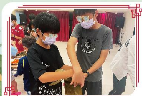
兩隻手還不夠！4隻手一起來