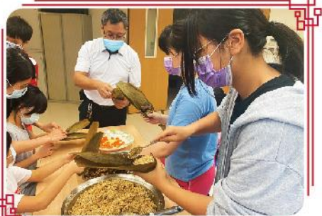
主恩包粽子初體驗

於是大家趕緊備妥了食材，孩子們將粽葉一片片仔細的刷洗，食材也洗得乾淨溜溜後，老師帶著學生學習炒配料；待香噴噴的配料完成後，