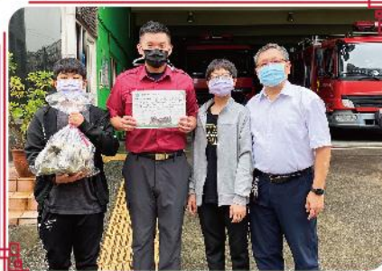
感謝消防阿姨叔叔您們辛苦了

老師首先示範粽葉折法與綁繩方式，有趣的是，看著簡單，實際操作是另一個世界呢！孩子的第一顆粽子大多花了10來分鐘才完成，且形狀相當特別！在大家齊心協力下，終於完成了一顆顆「獨一無二」的粽子。