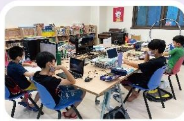
早上9點的主恩圖書室

疫情衝擊下，有許多郵件寄達的時間延誤；也有些地區無法寄送。為了讓關心基金會及主恩兒家的您，快速且不漏失任何訊息，歡迎您掃下方版權頁 QR code 我們將第一時間將家中大小事傳遞給您！