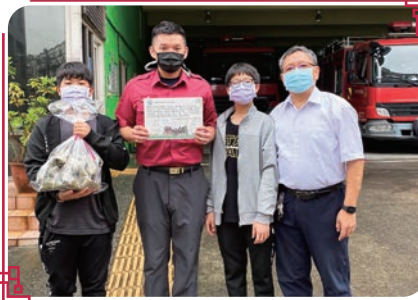
感謝消防阿姨叔叔您們辛苦了

老師首先示範粽葉折法與綁繩方式。有趣的是，看著簡單，而實際操作卻是另一個世界呢！孩子的第一顆粽子大多花了10來分鐘才完成，且形狀相當特別！在大家齊心協力下，終於完成了一顆顆「獨一無二」的粽子。