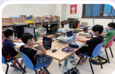
早上9點的主恩圖書室

疫情衝擊下，有許多郵件寄達的時間延誤；也有些地區無法寄送。為了讓關心基金會及主恩兒家的您，快速且不漏失任何訊息，歡迎您掃下方版權頁 QR code 我們將第一時間將家中大小事傳遞給您！