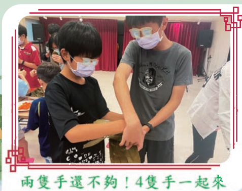
兩隻手還不夠！4隻手一起來