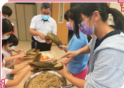
主恩包粽子初體驗

於是大家趕緊備妥了食材，孩子們將粽葉一片片仔細的刷洗，食材也洗得乾乾淨淨後，老師帶著學生學習炒配料；待香噴噴的配料完成後，