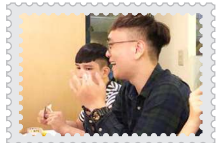
聽到兒家趣事 阿力忍不住開懷大笑