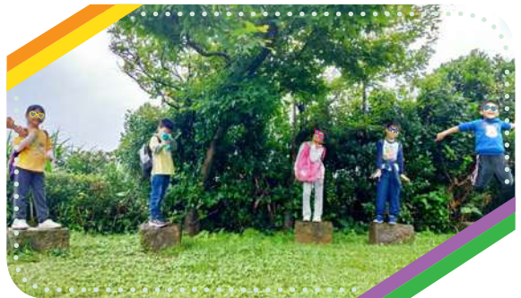
陪伴教育身心健康的孩子 是我們始終不變的初衷