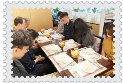
基金會陳牧師為畢業生祝福禱告