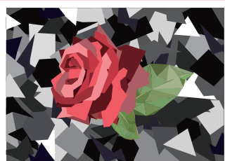
小羽作品 / 玫瑰