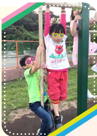
別看我個子小，爬竿、吊單槓都難不倒我