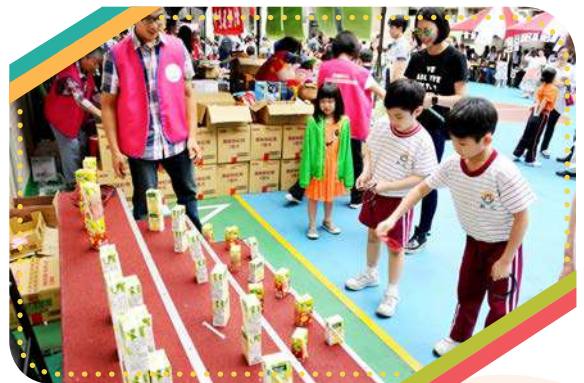
孩子們紛紛來到套圈圈攤位一展身手