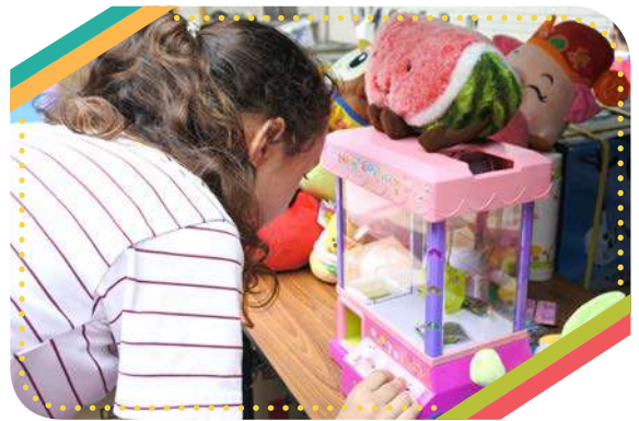
抓娃娃是園遊會中最熱門的遊戲之一