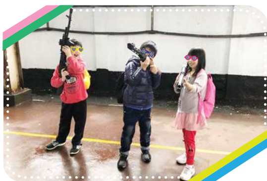
有模有樣的模擬射擊活動