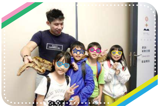
和新朋友大蟒蛇第一次接觸