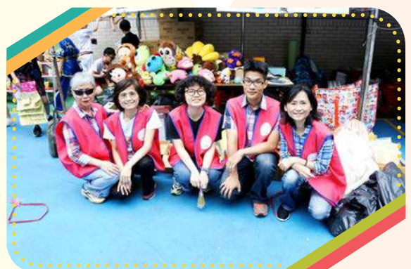
感謝志工頂著大太陽全力支持園遊會