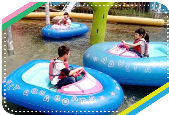
在兒童新樂園駕駛遊艇