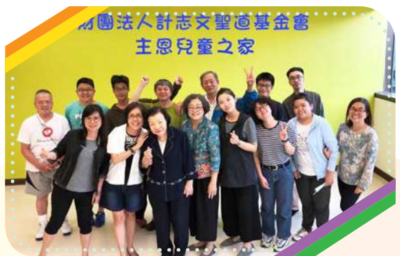
基金會全體同仁在主恩兒家合影， 請繼續為我們各項事工代禱