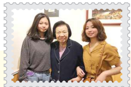
傅媽媽特別提醒兩個畢業女孩職場的安全問題