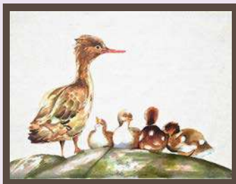
小伶作品 / 母鴨帶小鴨