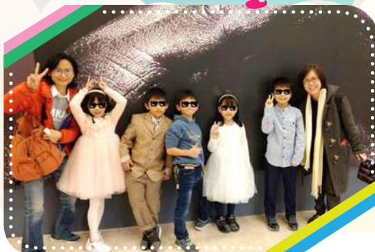
第一次踏上國家音樂廳殿堂

感謝全體同仁在忙碌的工作中仍然精心規畫，把孩子們的假日，安排的多彩多姿！今天就透過這一期家訊，向各位關心我們的捐助人享孩子們的假日時光。當您看到這一張張精彩歡樂的相片，心裡一定會我們有一樣的想法：「過去，孩子們也許不常是鏡頭下的主角，然而現在，他們常是我們眼光駐足的亮點。」