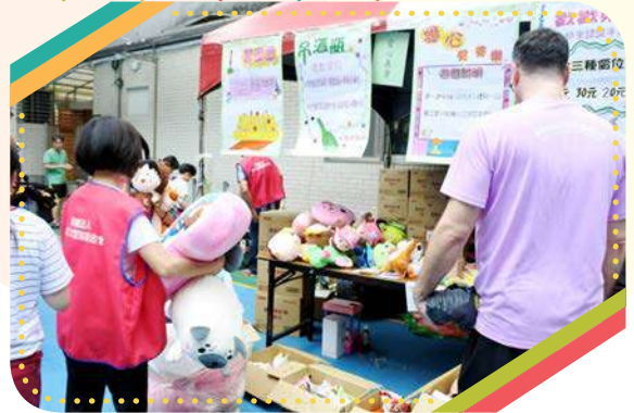
五花八門的遊戲和物資義賣

兒家的孩童因原生家庭的疏忽，導致他們沒有良好的環境接受完整的教育資源。來到兒家後，社工與老師發現孩童的課業較同齡層的孩子落後些，希望能夠讓他們接受課後輔導，由於所需經費龐大，因此本會發起了園遊會義賣活動。由衷感謝每一位幫助兒童之家與基金會的捐助人，因為您們無私的奉獻，讓今年的園遊會圓滿落幕，我們也會將義賣所得，全數挹注於主恩兒童之家失依兒少課輔費用，讓孩子有一個完整的學習環境。